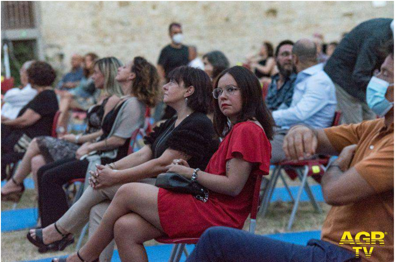
Spettatori del Prato Film Festival

(AGR) Il Prato Film Festival chiude la sua nona edizione con numeri da record: sono oltre 1.800 gli spettatori che dal 26 al 31 luglio sono passati dall'arena estiva cinematografica del Castello dell'Imperatore e dal PIN - Polo Universitario "Città di Prato" nel corso della manifestazione ideata e diretta da Romeo Conte.