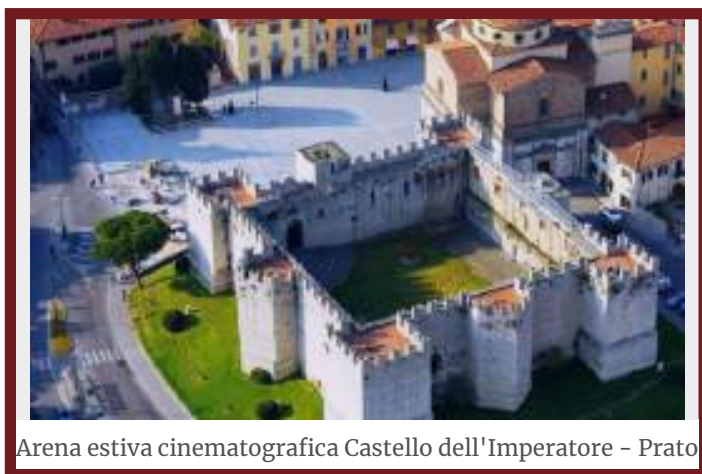
Arena estiva cinematografica Castello dell'Imperatore - Prato

“Il Prato Film Festival lancia un messaggio forte: la cultura non si può fermare.”