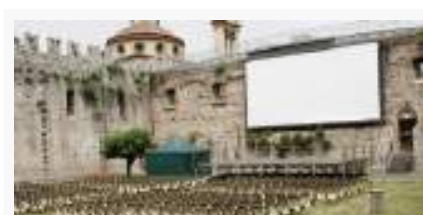
Arena estiva cinematografica Castello dell'Imperatore - Prato

neggiatori di capolavori come “Amici nese del Grillo”, “Matrimonio antozzi” e moltissimi altri film di culto.