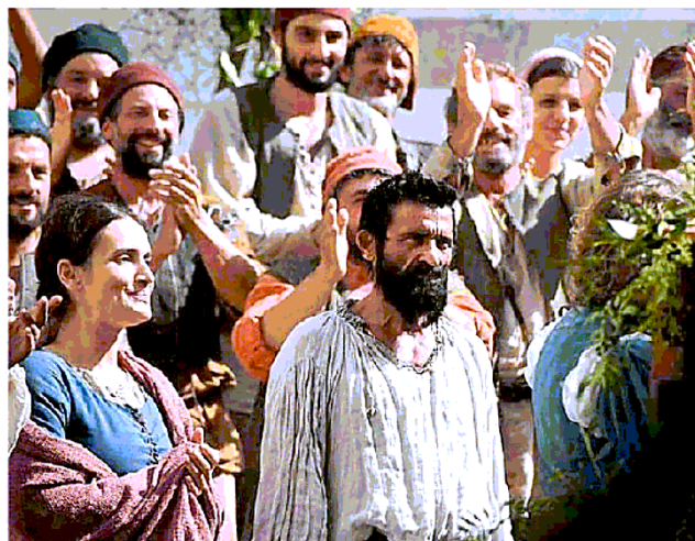
Una scena del film di Koncalovskij